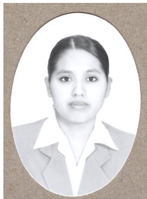
Fotografía tamaño certificado