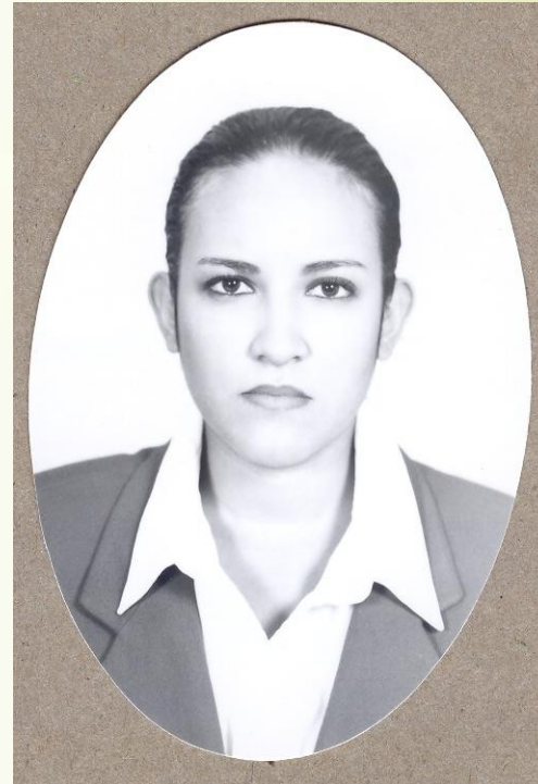
Fotografía tamaño título