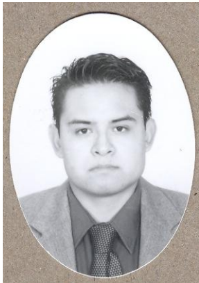
Fotografía tamaño certificado