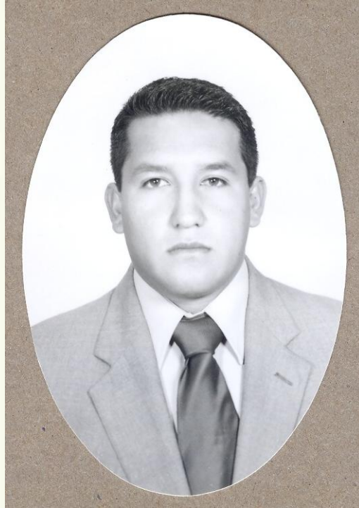
Fotografía tamaño título